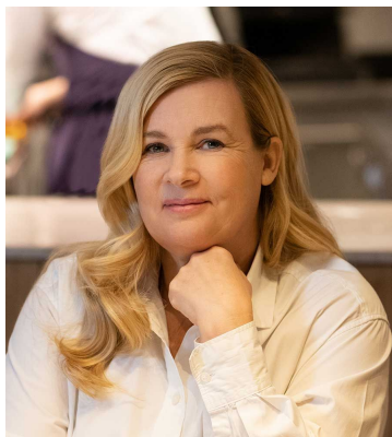
Hélène Darroze** Marsan Paris

Des chef.fes gastronomiques dont 23 étoilé.es :